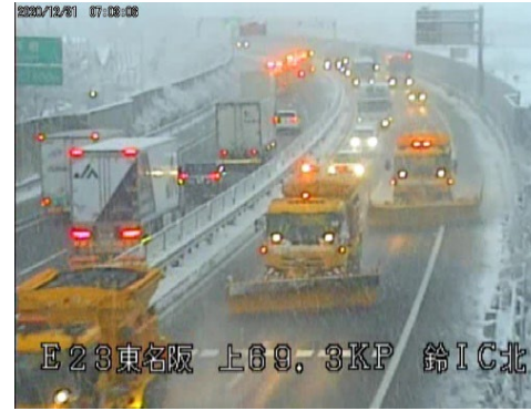
東名阪道 上69.3KP 付近除雪状況