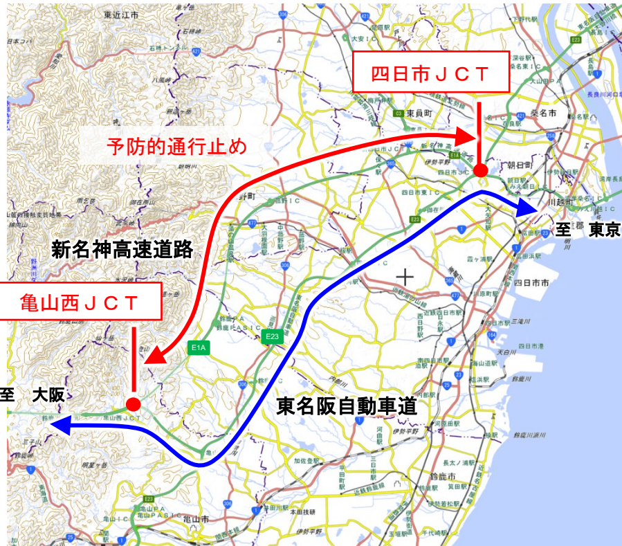
地理院地図(国土地理院)( https://maps.gsi.go.jp/ )をもとに、中日本高速道路株式が加工