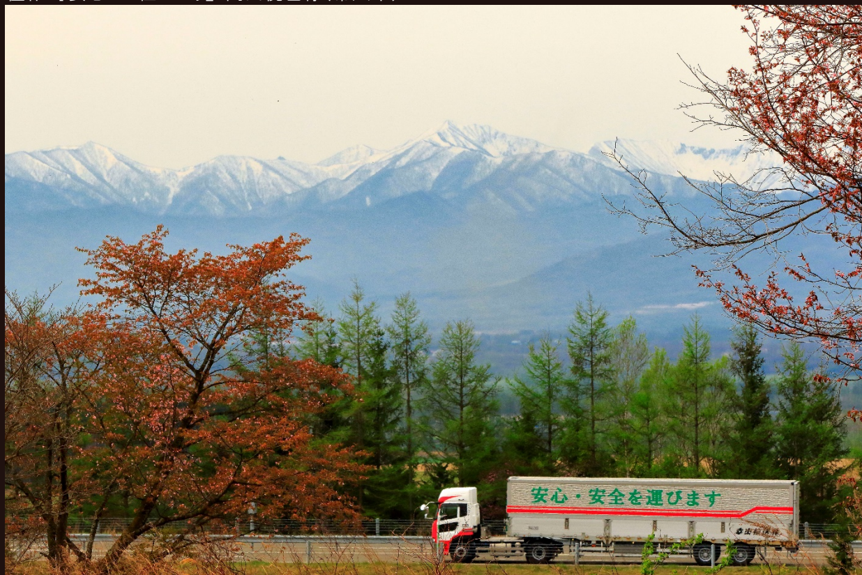
道東道/芽室IC～十勝清水IC/2019年5月撮影