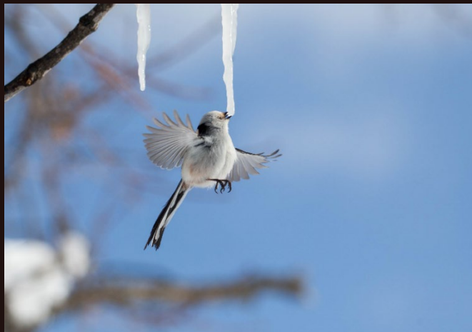
弟子屈町/2020年2月撮影