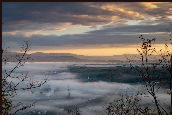
道央道/深川IC～旭川鷹栖IC/2020年10月撮影