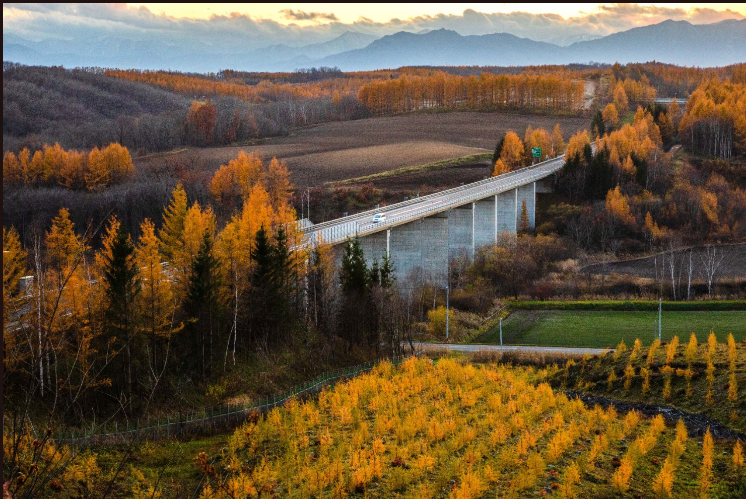
道東道/芽室IC～音更帯広IC/2020年11月撮影