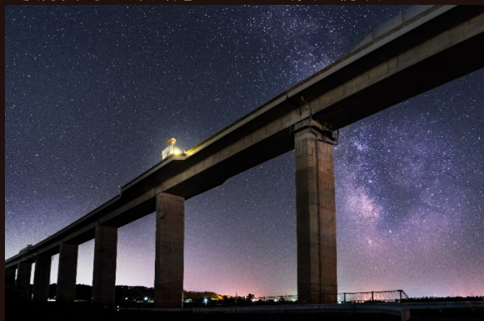
道央道/伊達IC～虻田洞爺湖IC/2020年5月撮影