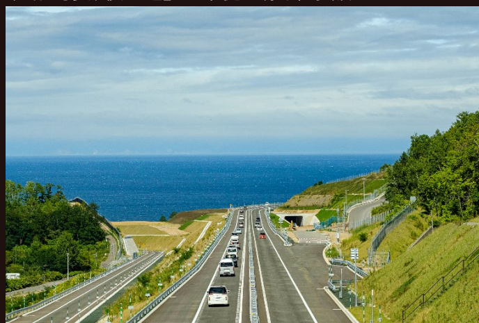
後志道/小樽JCT～小樽塩谷IC/2019年8月撮影