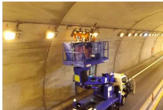
【トンネル内作業状況】