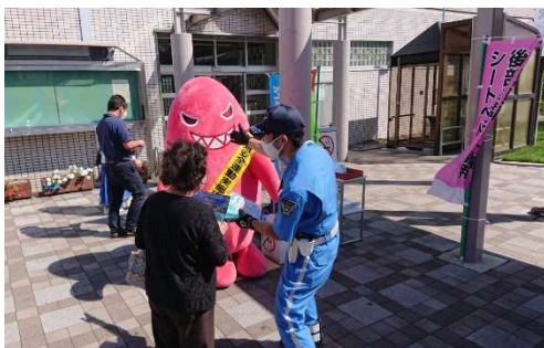
関係機関と合同で安全啓発