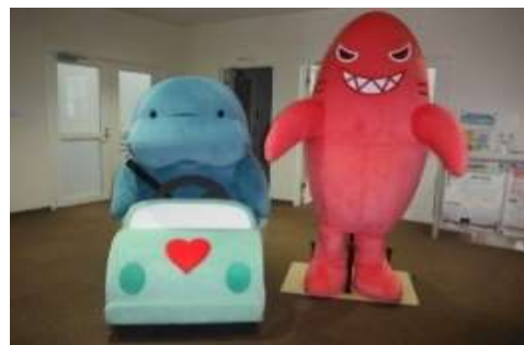
NEXCO東日本オリジナルキャラクター マナーティ(左)・イカンザメ(右)