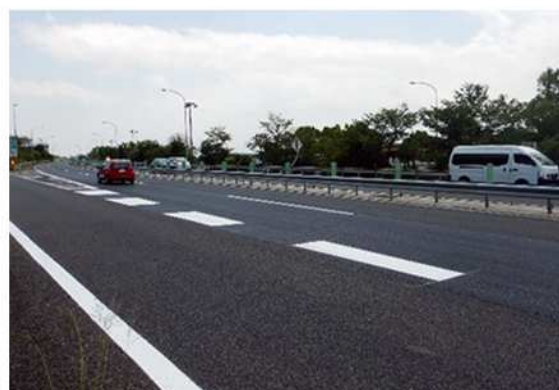
<舗装補修後イメージ図>