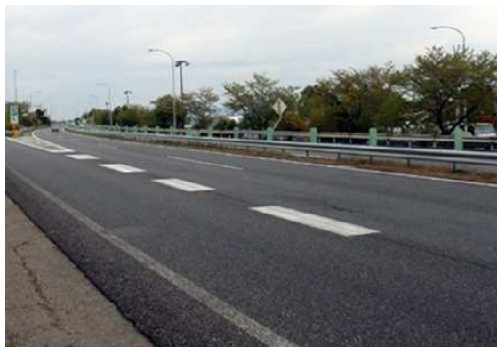
<舗装補修前イメージ図>