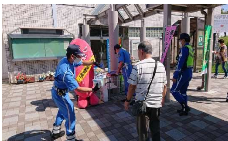
関係機関と合同で安全啓発