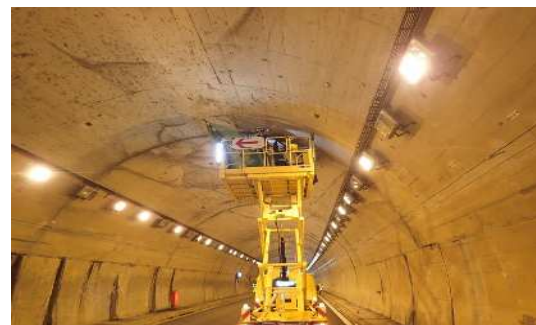
【トンネル補修工事】