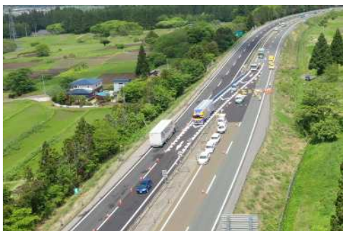
【対面通行規制状況】