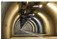
関越トンネル 避難坑

◎現在NEXCO東日本が実施している関越トンネル見学ツアーは、大変好評をいただいております。毎回満席となります。