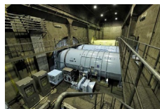
関越トンネル 谷川地下換気所