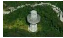
関越トンネル 谷川立坑