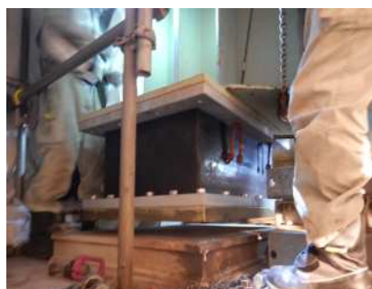
支承取替後(イメージ)