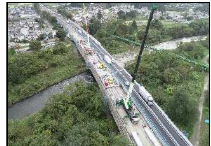
【対面通行規制状況】