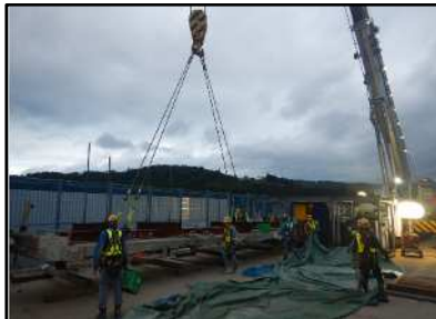
【古い床版撤去状況】