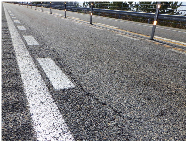
損傷した路面の状況

日本海東北自動車道 新潟空港IC～荒川胎内ICの損傷した路面の補修などを行います。