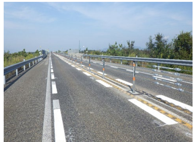
ワイヤロープの設置イメージ