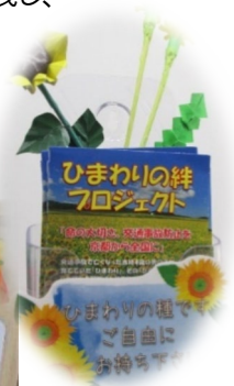
2021年夏・砂川ISA飾りつけの様子