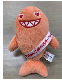
イカンザメぬいぐるみ (サイズ:7cm×10cm)