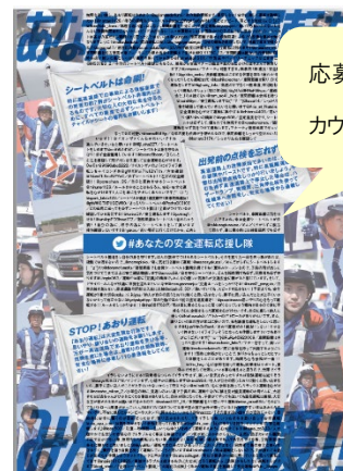
応募者のメッセージ入り クリアファイル