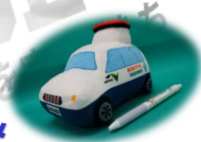
交通管理隊パトロールカーぬいぐるみ by北海道バージョン

そのうち50名さまには、 交通管理隊パトロールカーぬいぐるみ をオリジナルグッズとあわせてプレゼント！