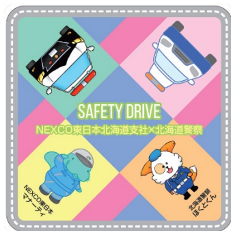
オリジナルミニタオル (サイズ:20cm×20cm)