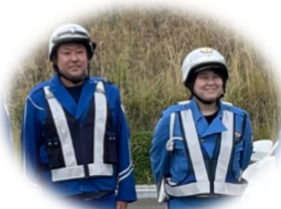
NEXCO 交通管理隊員 × 道警 高速隊員

たくさんの危険な現場を見てきた私たちの交通安全に対する思いを今回の動画に込めています。多くの方に見ていただき、お客さま一人ひとりの安全運転につながることを祈っております。