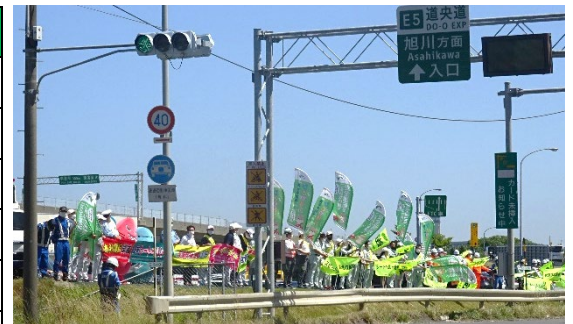
(2021年夏・札幌ICでの街頭啓発の様子)

※1 新型コロナウイルスの感染拡大状況によっては、実施内容の変更または中止となる場合があります。 また、交通安全キャンペーンでは、新型コロナウイルス感染拡大防止のため、お客さま対応を行うスタッフのマスクの着用のほか、アルコール消毒液の設置などを実施しています。現地では、スタッフの指示に従い、感染防止対策にご協力をお願いします。