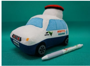
交通管理隊パトロールカーぬいぐるみ (サイズ:16cm×12cm)