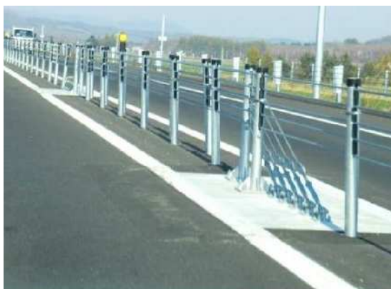
ワイヤロープ設置例

安全・快適に高速道路をご利用いただくために必要な工事ですので、ご理解とご協力をお願いします。