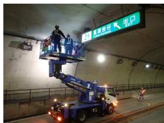
道路構造物点検作業状況