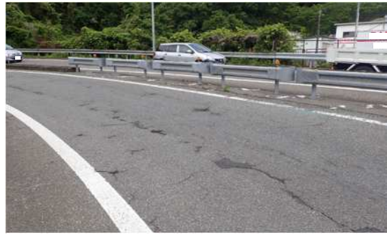
舗装路面損傷状況