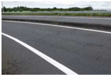
羽生IC舗装損傷状況

そのため、お客さまへ極力ご迷惑をおかけしないよう、交通量が少ない平日の夜間にランプの閉鎖を行い、工事を集中的かつ効率的に実施します。安全・快適に高速道路をご利用いただくために必要な工事ですので、ご理解とご協力をお願いします。