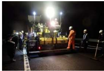
舗装補修工事 作業状況