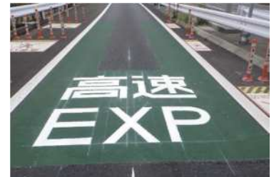
逆走対策工事 イメージ