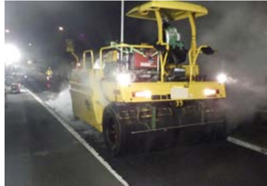
舗装補修工事 作業状況