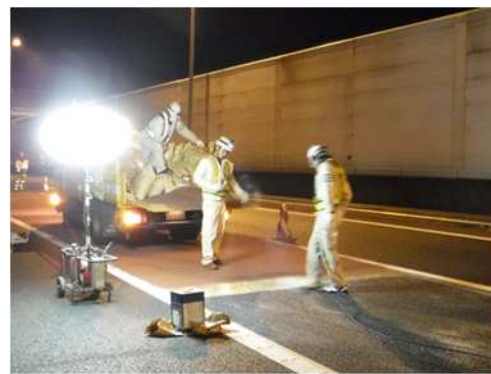
カラー舗装 作業状況