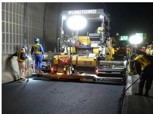
舗装補修工事 作業状況

この工事を行う区間は1車線であり、工事実施にあたって通常の車線規制では施工が出来ないことから、ランプを閉鎖して作業を行う必要があります。そのため、お客さまへ極力ご迷惑をおかけしないよう、交通量が少ない平日の夜間にランプの閉鎖を行い、工事を集中的かつ効率的に実施します。安全・快適に高速道路をご利用いただくために必要な工事ですので、ご理解とご協力をお願いします。