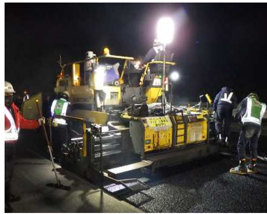
舗装補修工事 作業状況