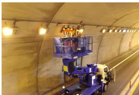
【トンネル内作業状況】