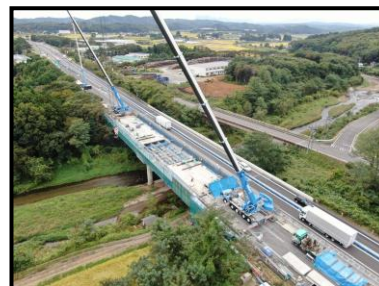
【対面通行規制状況】