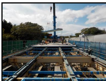
【新しい床版設置状況】