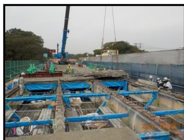
【古い床版撤去状況】