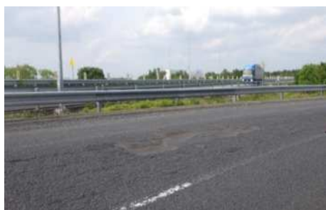
宇都宮上三川IC入口ランプ 舗装損傷状況

安全・快適に高速道路をご利用いただくために必要な工事ですので、ご理解とご協力をお願いします。