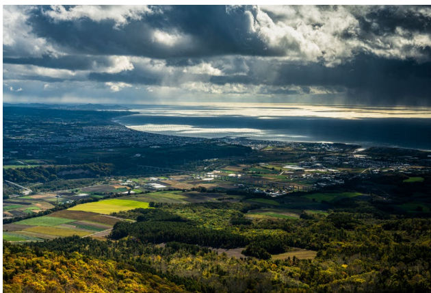
『大地と空と海、そしてそこに住む私たち』 (第12回「高速道路のある風景」部門最優秀賞)

また、作品募集開始に合わせて、5月19日(木)から21日(土)までの3日間、札幌駅前通地下歩行空間(チ・カ・ホ)で、昨年作品を募集した第12回コンテスト受賞作品の展覧会を開催します。