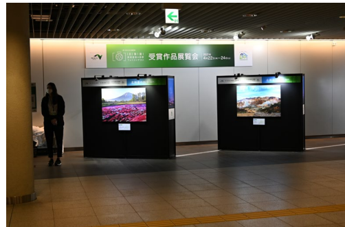
【展覧会のイメージ】