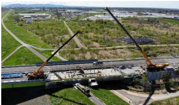
ゆうばりがわばし 道央自動車道 夕張川橋(下り線)の床版取替工事

高速道路のネットワーク機能を長期にわたって健全に保つため、老朽化した橋りょうの対策工事やトンネルの補強工事などを実施しています。令和3年度においては、道央自動車道 江別東IC～岩見沢IC間の夕張川橋(下り線)など、14橋の床版取替工事、1本のトンネルのインバート設置工事を完了しました。