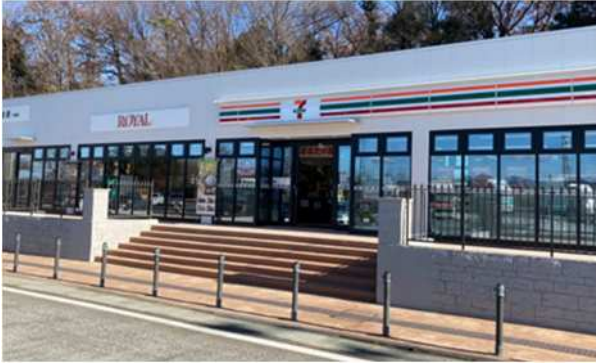
よりの 寄居PA(上り線)

お客さまへのサービス・利便性の向上のため、令和3年度に21店舗でSA・PAの改修工事を実施しました。また、お客さまからのご要望を受け、各主要路線を中心にシャワー設備(24時間営業)を新たに6店舗整備しました。