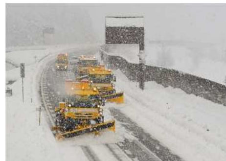
しおざわいしうち むいかまち 関越自動車道 塩沢石打IC～六日町IC 付近