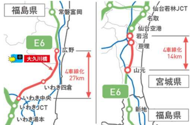
常磐自動車道4車線化工事区間