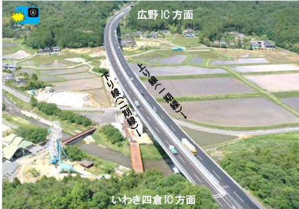
おおひさがわばし 大久川橋付近

復興創生期間内の概ね5年での完成を目指し、平成28年より事業を進めていた常磐自動車道・仙台東部道路の4車線化工事(いわき中央IC～広野IC間の約27km 及び山元IC～岩沼IC間の約14km)のうち、令和3年6月には残りの区間(約4km)も完成し、4車線運用を開始しました。