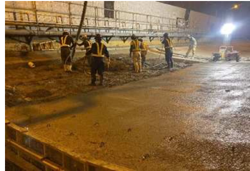
しるやま 北陸自動車道 城山トンネル(下り線)のインバート設置工事