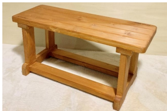
【販売予定の室内ベンチ】