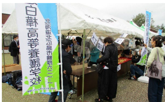
【令和2年10月の展示・販売会の様子(輪厚PA下り線)】