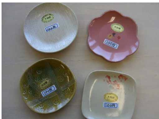
【販売予定の焼き物】

なお、この取り組みは、高速道路と福祉を結ぶ「高福連携」の一環として行っており、一昨年に引き続き実施するものです(昨年はコロナ感染拡大防止の観点から中止しました)。