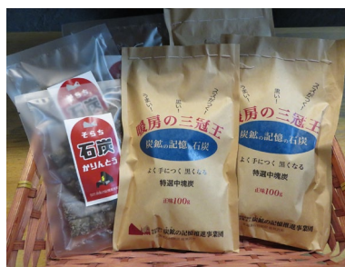
NPO法人炭鉱の記憶推進事業団 (岩見沢市) 石炭・炭鉱のイメージ商品販売・ パンフレット配布