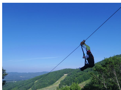
道の駅 遠軽 森のオホーツク (遠軽町) 特産品販売・ジップラインVR体験会