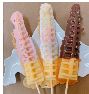
NAKAMICHI FARM (砂川市) 米・野菜・ワッフル等販売