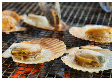
うまいよ！るもい市実行委員会 (留萌市) 「ホタテ炭焼き」販売