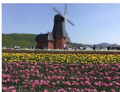
層雲峡・オホーツクシーニックバイウェイ (紋別市) パネル等展示・パンフレット配布