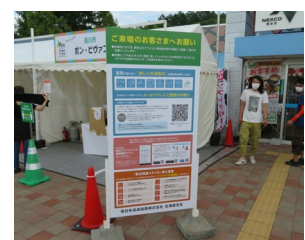
昨年度実施風景(砂川SA会場)