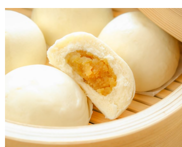
由仁町特産品販売推進協議会 (由仁町) 「東京ホルモン」等特産品販売