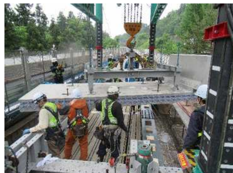
門型架設機による新たな床版の架設