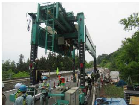
門型架設機組立状況