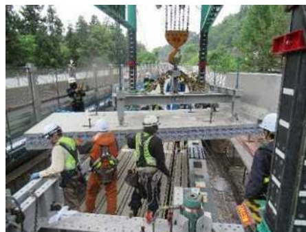
門型架設機による新たな床版の架設