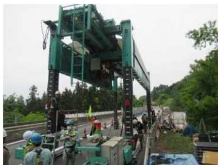
門型架設機組立状況