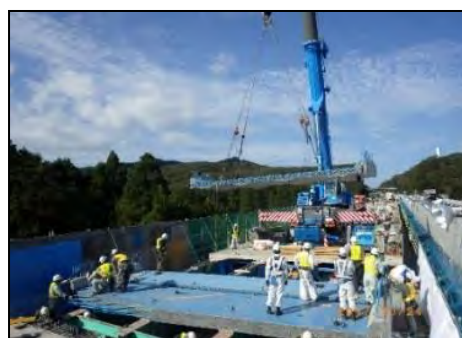
【新しい床版設置状況】