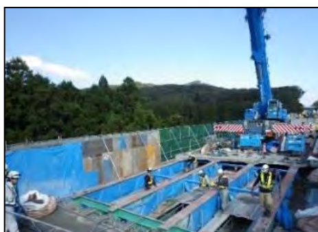
【古い床版撤去状況】