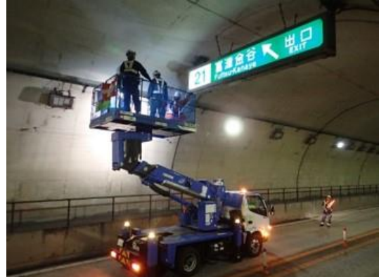
道路構造物点検作業状況