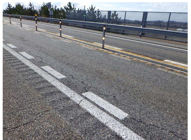
損傷した路面の状況