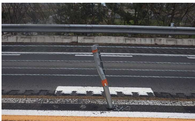
事故により損傷した付属物の状況