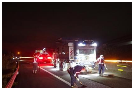
舗装補修工事 作業状況