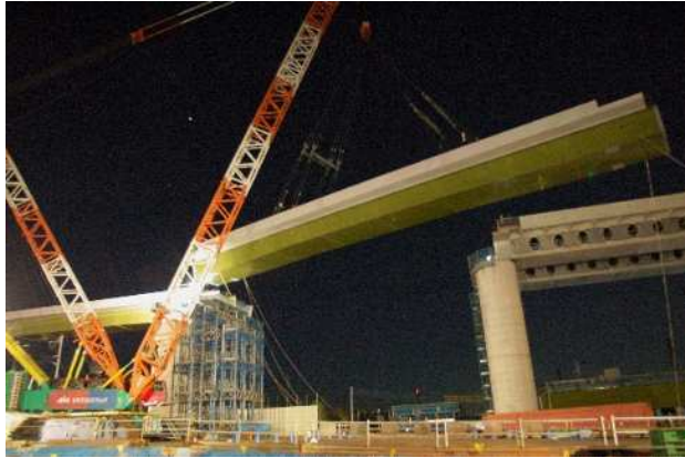
【一括架設工事の様子(参考)】