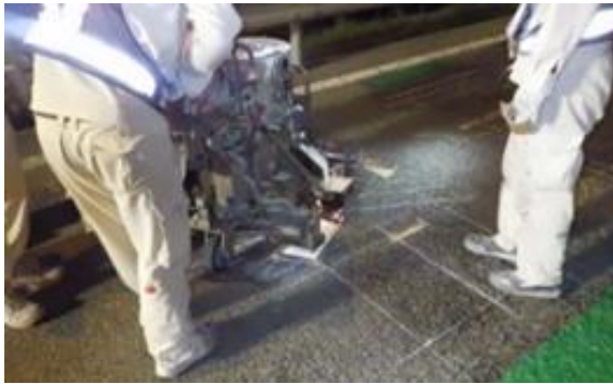
逆走対策工事 作業状況

安全・快適に高速道路をご利用いただくために必要な工事ですので、ご理解とご協力をお願いします。