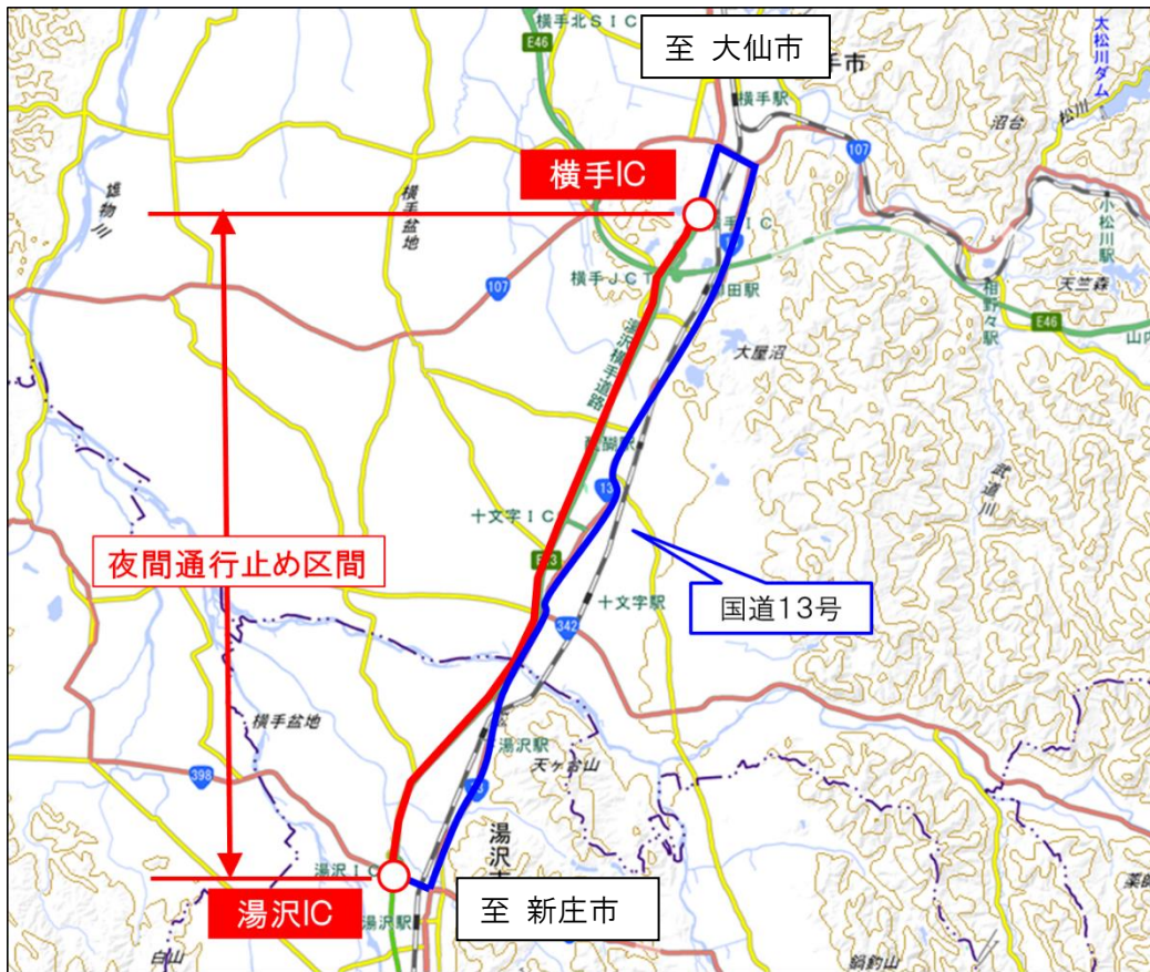
地理院地図(国土地理院)( https://maps.gsi.go.jp/ )をもとに、東日本高速道路㈱が加工

【通行止め区間・日時】 湯沢横手道路 湯沢IC～横手IC間(上下線) 令和4年10月31日(月) 20時～翌6時【1夜間】 【予備日:11月1日(火)・2日(水)】 ※夜間通行止めは、平日の20時から翌6時まで行います。 (2日の夜間工事は3日(祝日)の早朝6時まで行います)