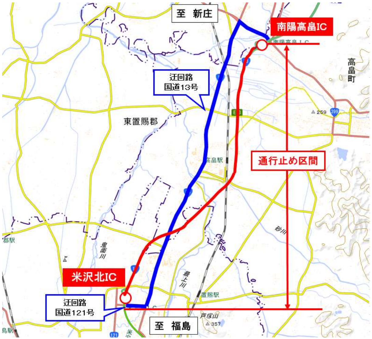
地理院地図(国土地理院)( https://maps.gsi.go.jp/ )をもとに、東日本高速道路株が加工

【通行止め区間・日時】 【1】東北中央自動車道 米沢北IC～南陽高畠IC間(上下線) 令和4年11月9日(水)、10日(木)、16日(水)、17日(木) 22時～翌6時【4夜間】 ※夜間通行止めは、平日の22時から翌6時まで行います。