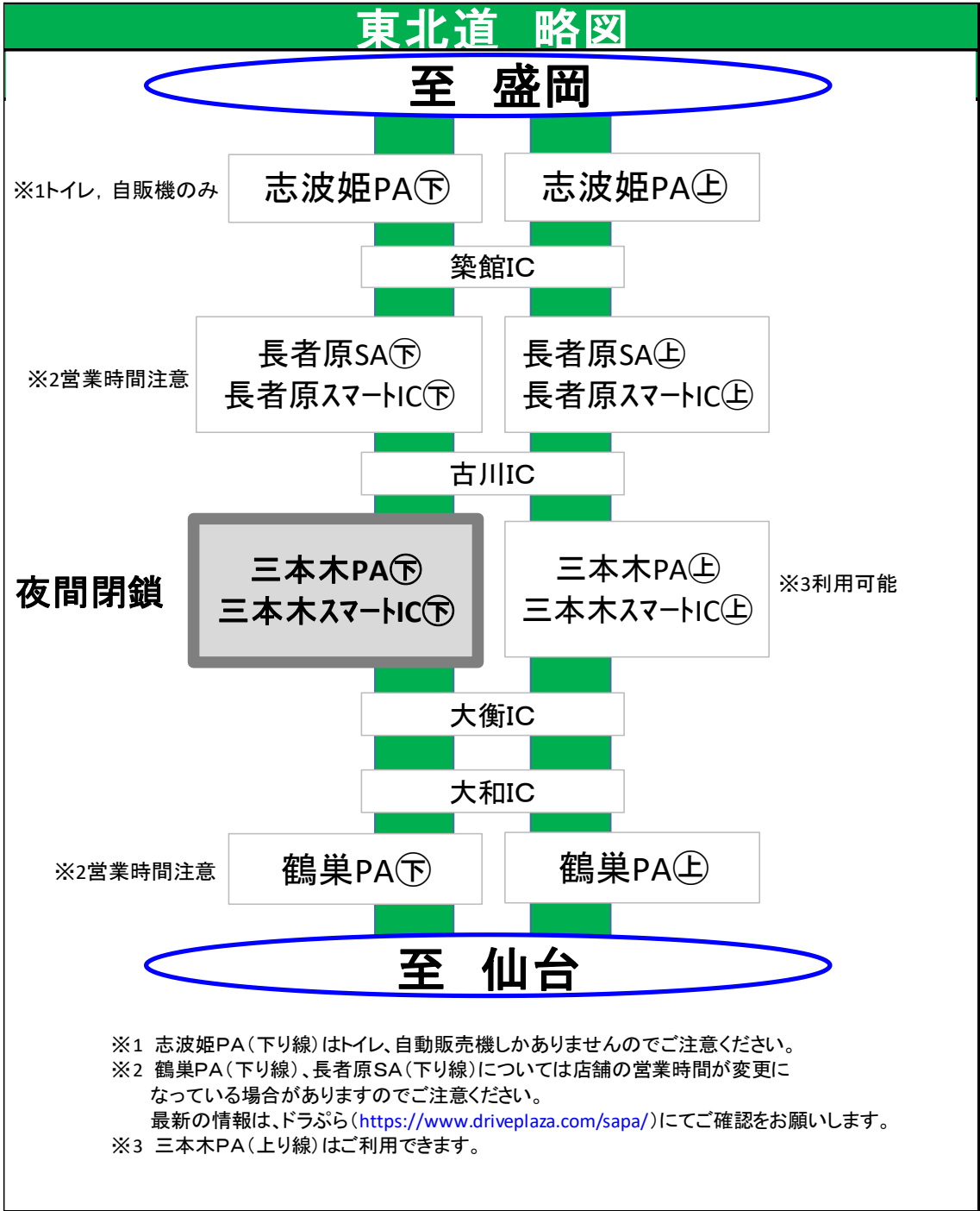
東北道 SA・PA配置概略図