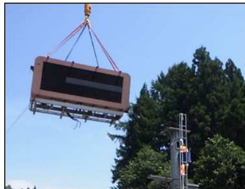
更新工事 作業状況イメージ