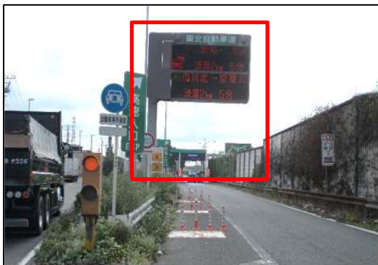
道路情報板 現地状況

そのため、お客さまへ極力ご迷惑をおかけしないよう、交通量が少ない平日の夜間にランプの閉鎖を行い、工事を集中的かつ効率的に実施します。安全・快適に高速道路をご利用いただくために必要な工事ですので、ご理解とご協力をお願いします。