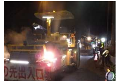
舗装補修工事 作業状況