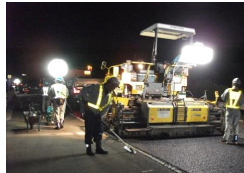
夜間舗装補修工事 作業状況