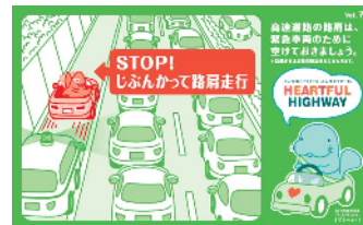
路肩は緊急車両のために 空けておきましょう！