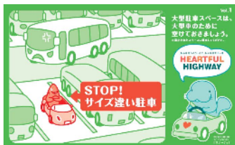
自分の車のサイズに合った 駐車マスに停めましょう！