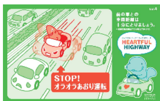
イライラ運転は思わぬ大事故に… ゆとりをもったドライブ計画を！