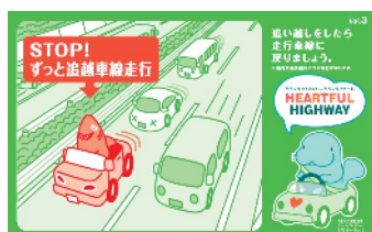
追い越し後は後方確認をおこない、 走行車線に戻りましょう！