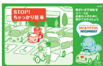
障がいをお持ちの方や妊婦さんのためのスペースです。 本当に必要な方のために空けておきましょう！