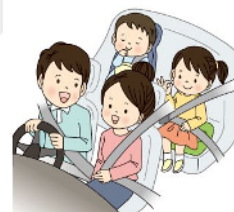
チャイルドシートも忘れずに！

高速道路などの死亡事故で後部座席同乗者の死亡者のうち約7割がシートベルト非着用。全席着用義務となっていますので、後部座席同乗者も必ずシートベルトを着用しましょう！