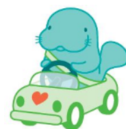
マナーアップキャラクター 「マナーティ」