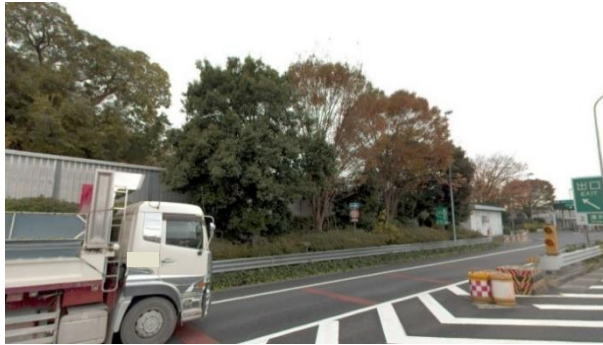
浦和IC 出口ランプ 現況

そのため、お客さまへ極力ご迷惑をおかけしないよう、交通量が少ない平日の夜間にランプの閉鎖を行い、作業を集中的かつ効率的に実施します。安全・快適に高速道路をご利用いただくために必要な作業ですので、ご理解とご協力をお願いします。