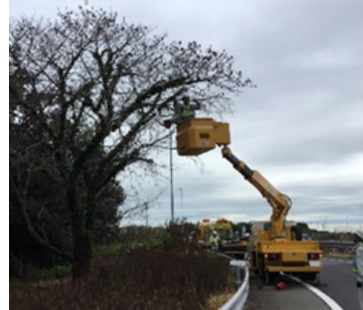
伐採作業イメージ図