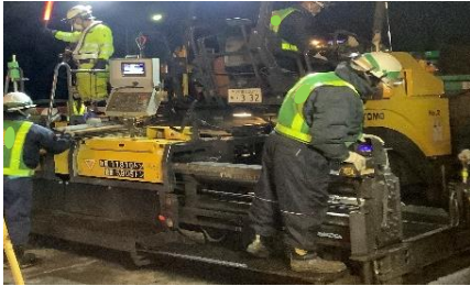
舗装補修工事 作業状況

安全・快適に高速道路をご利用いただくために必要な工事ですので、ご理解とご協力をお願いします。