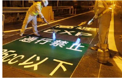
逆走対策工事 作業状況