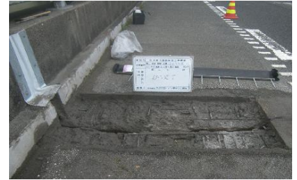
伸縮装置取替工事 作業状況