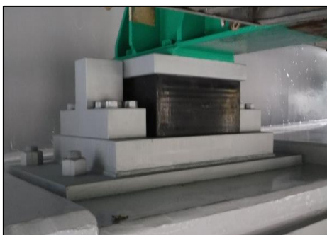
支承取替後(イメージ)