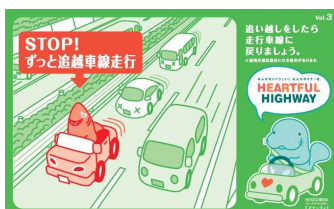
追越し後は後方確認をおこない、 走行車線に戻りましょう！