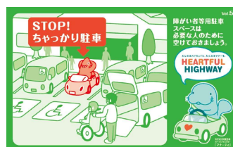
障がいをお持ちの方や妊婦さんのためのスペースです。 本当に必要な方のために空けておきましょう。