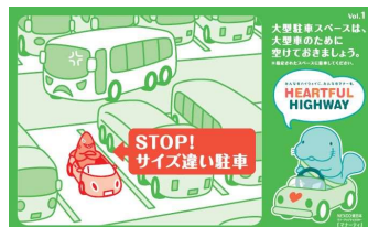
自分の車のサイズに合った 駐車マスのに停めましょう！