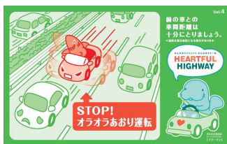
イライラ運転は思わぬ大事故に… ゆとりをもったドライブ計画を！