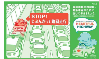
路肩は緊急車両のために 空けておきましょう！