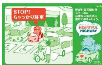
障がいをお持ちの方や妊婦さんのためのスペースです。 本当に必要な方のために空けておきましょう！