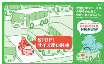
自分の車のサイズに合った 駐車マスに停めましょう！