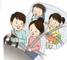
チャイルドシートも忘れずに！

高速道路などの死亡事故で後部座席同乗者の死亡者のうち約7割がシートベルト非着用。全席着用義務となっていますので、後部座席同乗者も必ずシートベルトを着用しましょう！