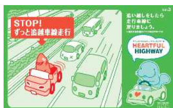
追い越し後は後方確認をおこない、 走行車線に戻りましょう！