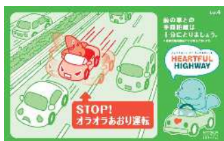
イライラ運転は思わぬ大事故に… ゆとりをもったドライブ計画を！