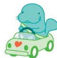
マナーアップキャラクター 「マナーティ」