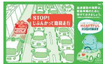
路肩は緊急車両のために 空けておきましょう！