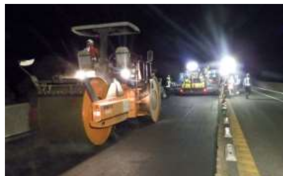
舗装補修工事 作業状況