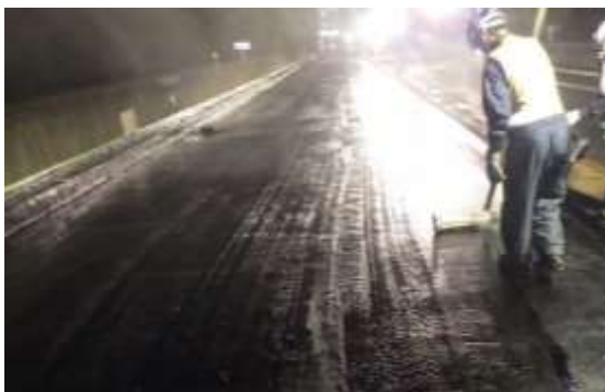
床版防水工事 作業状況

そのため、お客さまへ極力ご迷惑をおかけしないよう、交通量が少ない平日の夜間にランプの閉鎖を行い、工事を集中的かつ効率的に実施します。安全・快適に高速道路をご利用いただくために必要な工事ですので、ご理解とご協力をお願いします。