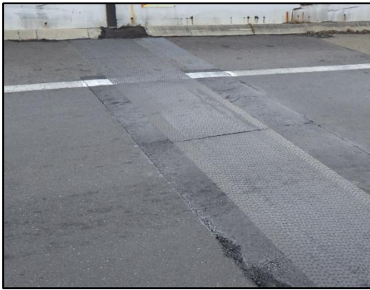
橋梁伸縮部損傷写真

そのため、お客さまへ極力ご迷惑をおかけしないよう、交通量が少ない平日の夜間にランプの閉鎖を行い、工事を集中的かつ効率的に実施します。安全・快適に高速道路をご利用いただくために必要な工事ですので、ご理解とご協力をお願いします。