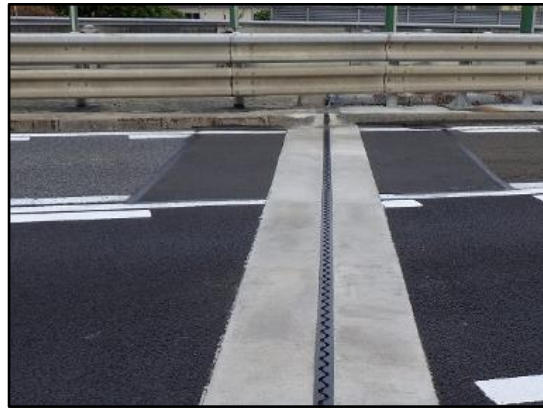
橋梁伸縮部補修完了後イメージ