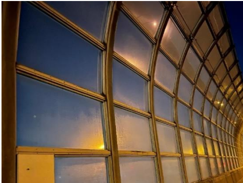
遮音壁損傷状況(白亜化)

そのため、お客さまへ極力ご迷惑をおかけしないよう、交通量が少ない平日の夜間にランプの閉鎖を行い、工事を集中的かつ効率的に実施します。安全・快適に高速道路をご利用いただくために必要な工事ですので、ご理解とご協力をお願いします。