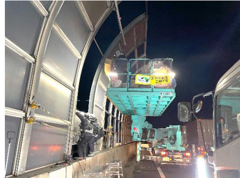
遮音壁取替工事 作業状況