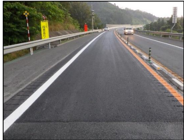
舗装補修後(イメージ)