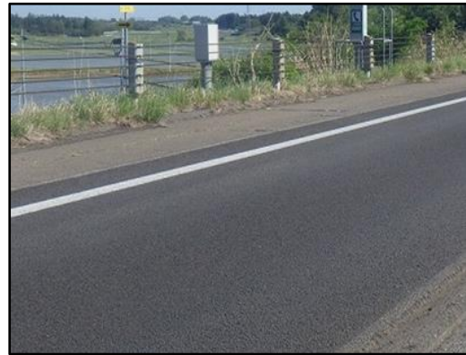
舗装補修完了状況(イメージ)